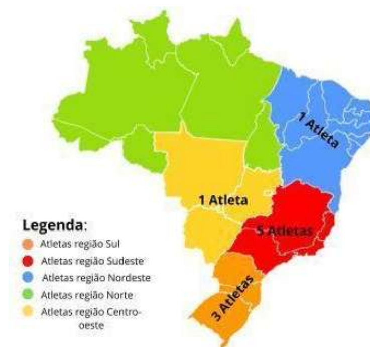
Figura 1 – Regionalização do esporte paralímpico brasileiro.

Nesta categoria será abordado e investigado a regionalização do esporte paralímpico no Brasil. Para tanto, foi construído um instrumento com o objetivo de identificar as regiões brasileiras que possuem um número maior de atletas e compreender os fatores influenciadores.