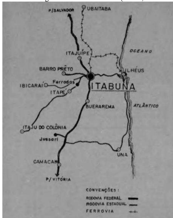
Imagem 1: Triáde de lugares-referência na obra (Ilhéus, Itabuna e Ferradas).

Dessa forma, o auge do crescimento econômico impulsionado pela cultura cacauera ocorreu em um contexto de valorização internacional do produto, marcado por intensos fluxos migratórios, expansão territorial e a fundação de novas fazendas e centros urbanos, especialmente entre as décadas de 1920 e 1930, no início do século XX. A seguir, é possível observar a demarcação territorial de onde se passa o enredo da obra: