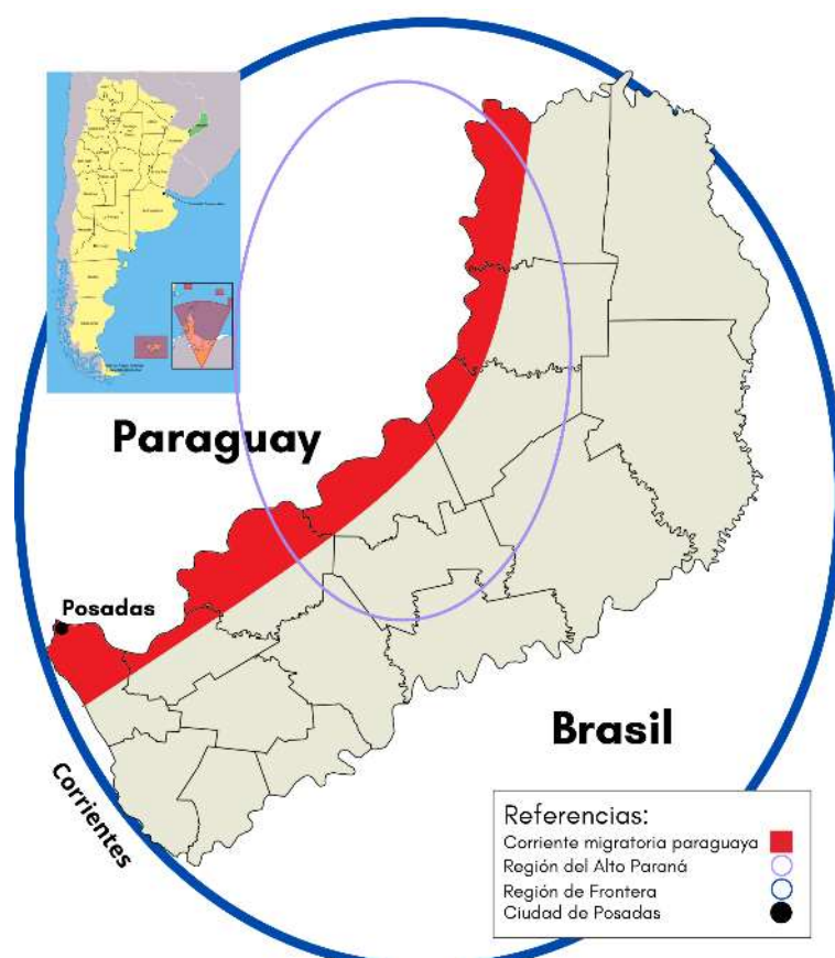
MAPA 1 – CORRIENTE MIGRATORIA PARAGUAYA EN MISIONES.

Una gran porción de estos pobladores que escapaban se movilizó por los poblados de la franja del río Paraná (Ver Mapa 1), radicándose en la ciudad de Posadas (actual Capital de Misiones), pero también desplazándose por los pueblos y colonias de la región denominada Alto Paraná, hasta asentarse definitivamente en lugares de la franja costera.